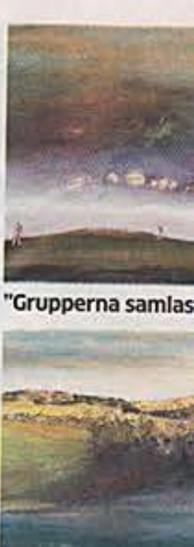
"Två ger sig av"