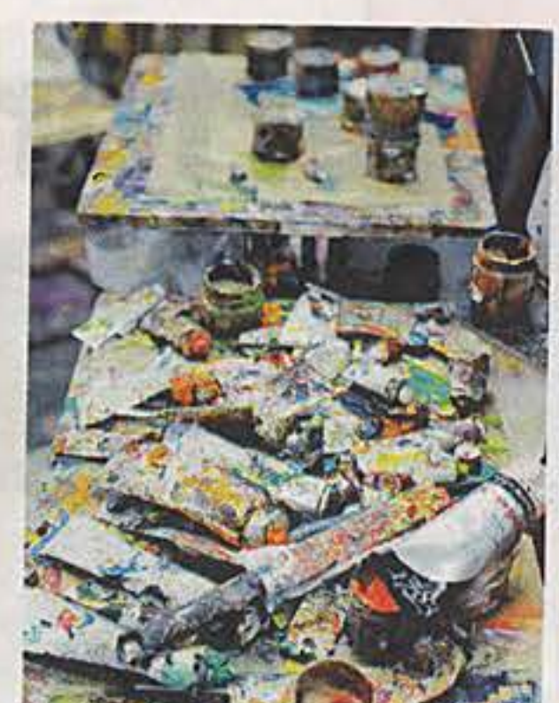
"Jag har en djävulsk massa färger."