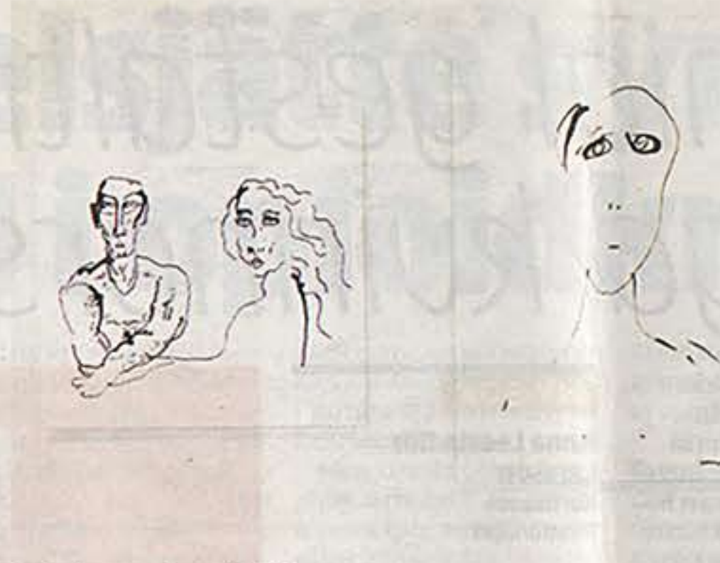
Teckningar av Lars Erik Eriksson.