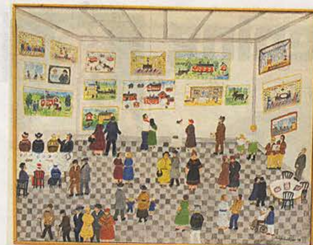
Målning av Sonja Eriksson.