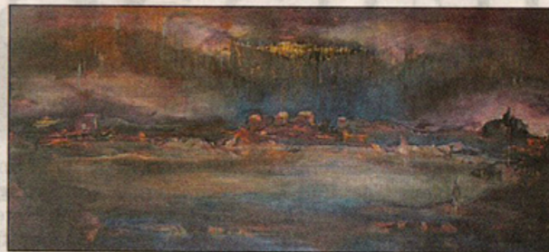
● Regn, olja